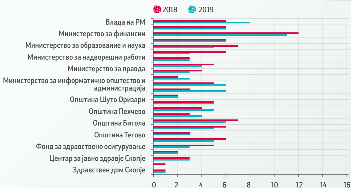
Графикон 1. Процент на објавени документи и информации за 2019 година по вид на институции/власт

Девет (9) институции во 2019 во однос на 2018 година објавиле помалку документи. Еден документ помалку објавиле: Центар за јавно здравје Кочани; Локалните самоуправи во Тетово и Струмица; и Министерствата за внатрешни работи, надворешни работи и финансии. Два документи помалку имаат објавено Фондот за здравствено осигурување и Министерството за образование и наука. А пак, најголемо намалување е забележано кај Министерството за култура кое објавило три документи помалку во однос на претходната година (види графикон 2).